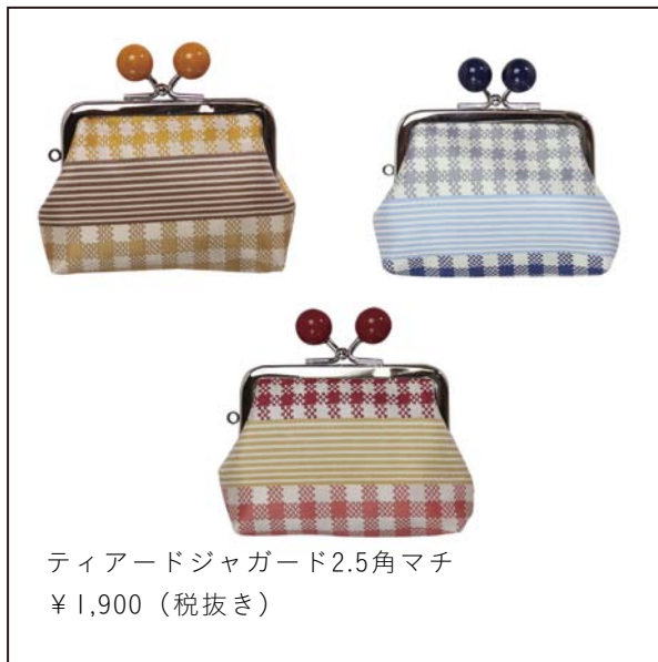
ティアードジャガード2.5角マチ ¥1,900 (税抜き)