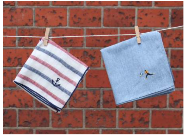
左 マリンボーダー 864円(税込)

水玉のダブルガーゼの生地に、京都らしいモチーフの刺繍が入ったハンカチです。京都のおみやげにぴったりの商品です。