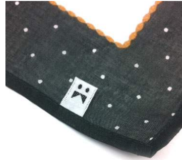
ハンカチには、ハンカチベーカリーのロゴマークの織ネームがついています。