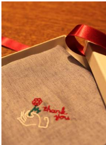
メッセージ 948円(税込)

シンプルかつ遊び心のあるデザインで、男性の方にも使っていただきやすいハンカチも揃います。