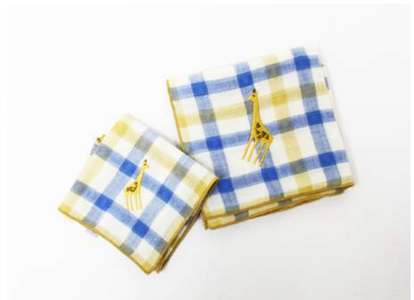
左 アニマルチェックキッズ 648円(税込)

贈り物に最適な、気持ちを添えたメッセージ入りのハンカチです。用途に合わせて3種類あります。