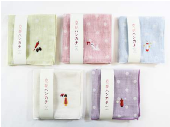
京都ハンカチ 648円(税込)

水玉のダブルガーゼの生地に、京都らしいモチーフの刺繍が入ったハンカチです。京都のおみやげにぴったりの商品です。