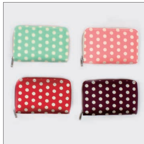
ジャガードカードケース 1,680円 11.5×7.5×1.5cm