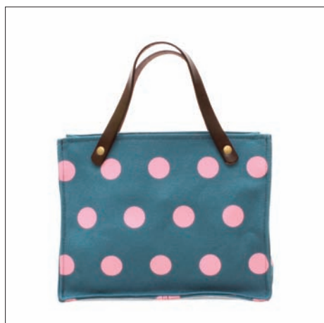
帆布プリントミニバッグ 3,990円 23.5×17.5×9cm