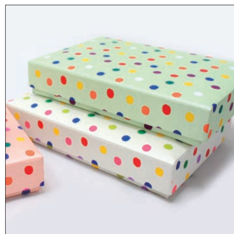
「dot・dot KYOTO」では 京都の老舗紙専門店の 商品などセレクトします。

オリジナル商品は、自社ブランドであるカラネコロン京都やぼっちりで 培った技術や製造工程を活用したものを 水玉をキーコンセプトに新たなデザインを表現します。 またお店ではコラボレート商品やセレクト商品なども 今後増えていく予定です。