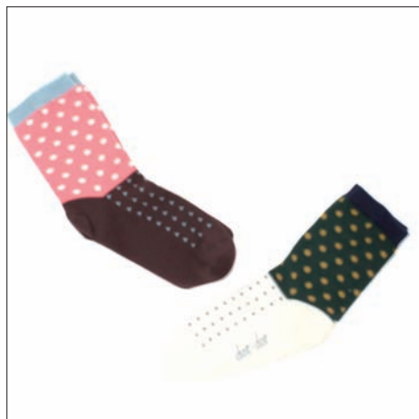
シルク混ソックス 840円 23～25cm