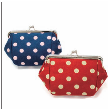
帆布化粧ポーチ 2,100円 19×10×10.5cm