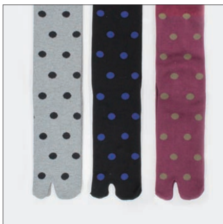
紳士用たびソックス 630円 25～27cm