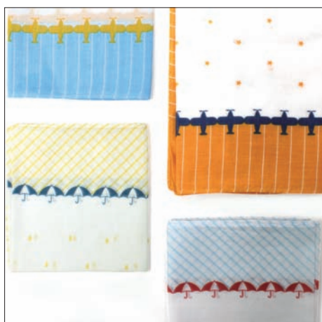
スカイ 840円 48×48cm 綿ローン