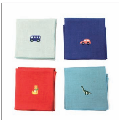
トイ キッズ 525円 25×25cm ダブルガーゼ