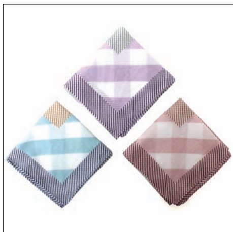
ストライプストライプ 840円 48×48cm 綿ローン