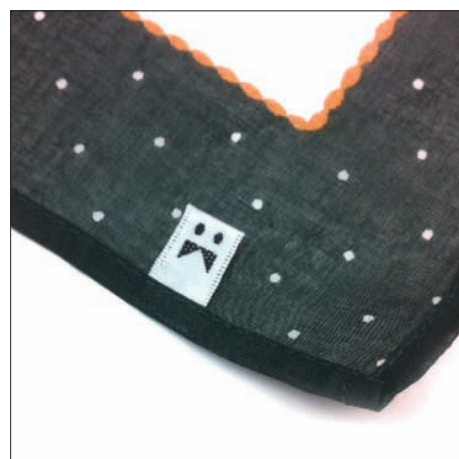
オリジナルハンカチには ハンカチベーカリーの 織ネームがついています。

ハンカチオリジナル商品は、ジャパンメイド。 京都・手捺染染め、大阪・泉州タオル、愛媛・今張タオル、 兵庫・播州織物、奈良・機械刺繍 などの国内の産地にて長年培われた技術を用いて丁寧につくられています。