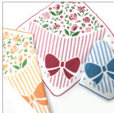
ブーケ 630円 25×25cm ダブルガーゼ