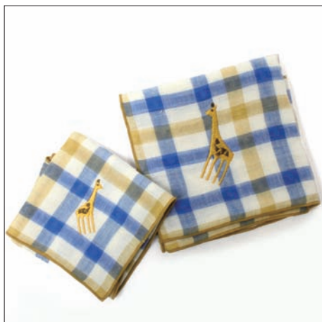
アニマルチェック 735円 48×48cm ダブルガーゼ アニマルチェック キッズ 525円 25×25cm ダブルガーゼ